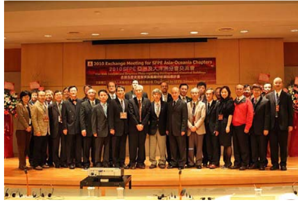
2010 SFPE 亞洲及大洋洲分會交流會議，台灣台北，2010年10月28-29日 會議主題：古跡和歷史建築火災風險分析與應變計劃

許多概念，包括以前提到過的 ASET-RSET 理念，並沒有正確的應用於 FEA-PBD 項目。這可能導致非常嚴重的後果。目前有許多新的活動正在或即將舉辦，例如 SFPE 表現為本會議。