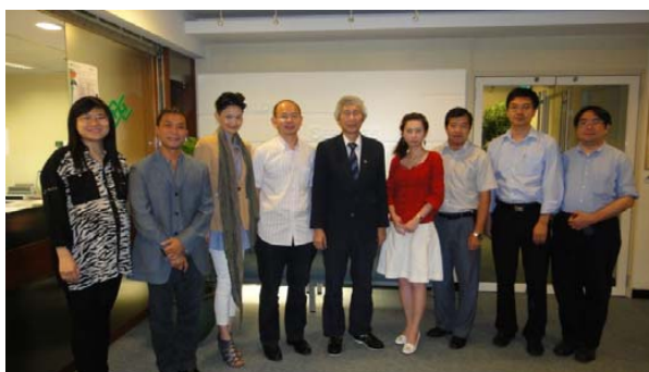
SFPE 香港分會委員，2011年8月

防火工程師協會（SFPE）組織了很多關於火災工程的活動，但很多香港的專業人士並不知道這些活動。有些本地消防專業人士甚至不知道什麼是 SFPE，儘管在日常工作中他們和他們的夥伴常都會接觸 SFPE 出版的各種消防手冊。